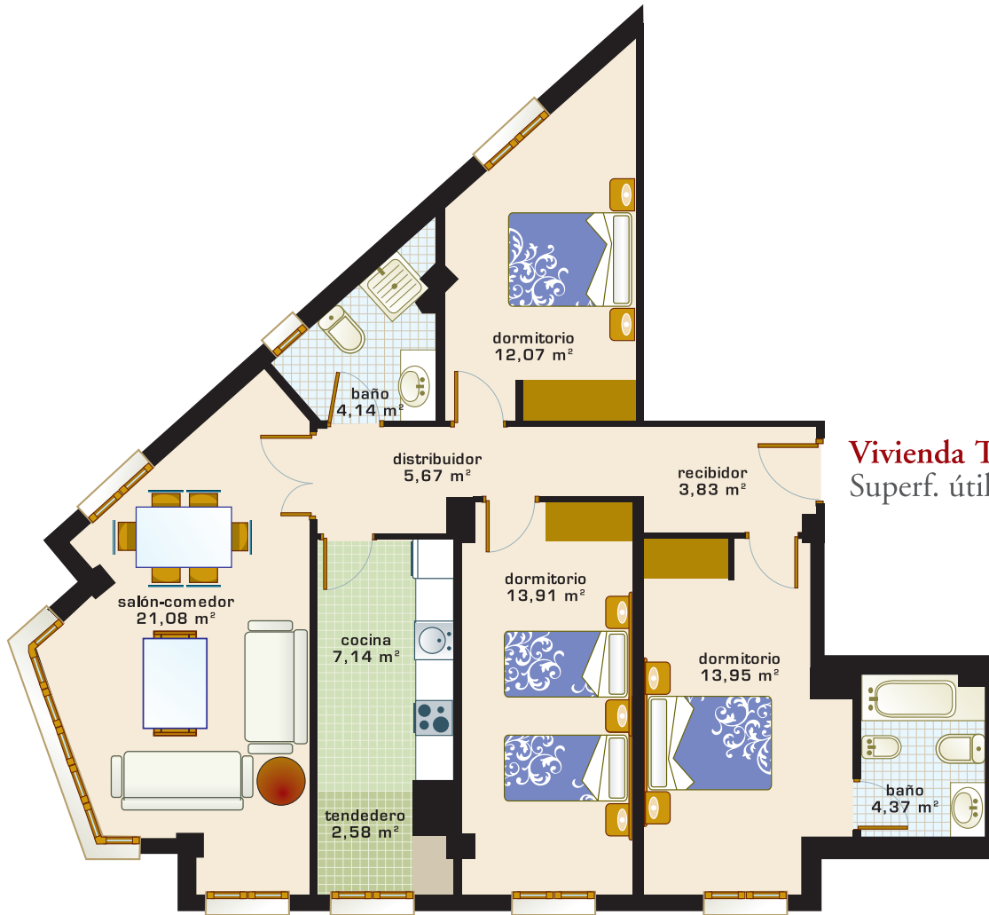
Vivienda Tipo D Superf. útil aprox.: 88,74 m 2

Esta lamina no constituye documento contractual, siendo la ilustración meramente orientativa.